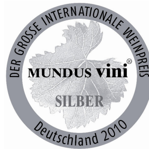
Médaille « Argent » 2010