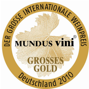
Médaille « Grand or » 2010