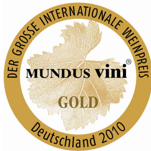
Médaille « Or » 2010