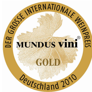
Medalla Oro 2010