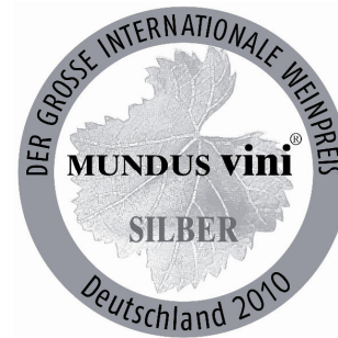
Medalla Plata 2010