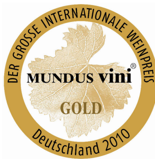
Medaglia d'Oro 2010