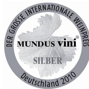
Medaglia d'Argento 2010