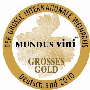
Medaglia Grande Oro 2010