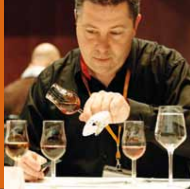
Arthur Nägele Spirituosenakademie (Österreich)

Das Verkostungssystem des ISW ist für mich persönlich ein Highlight der internationalen Prämierungsszene. Eine gute Balance aus sensorisch-technischer und verbaler Beschreibung scheint der Prämierung gelungen zu sein!